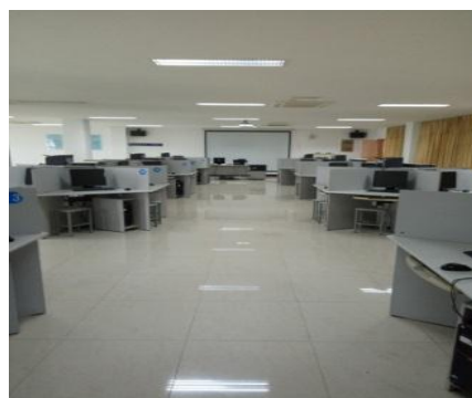
办公室自动化实训室